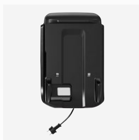
Stazione di ricarica e stoccaggio